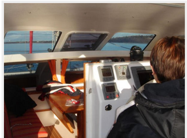
View from Steering Station