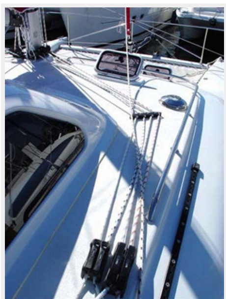
Clean Running Rigging