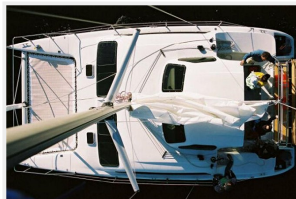
View from Mast Top