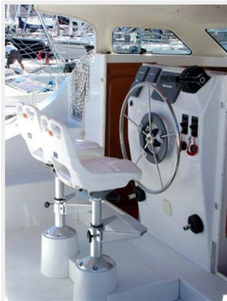
Twin Helm Seats