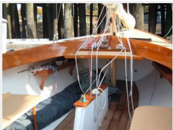
Lines led aft