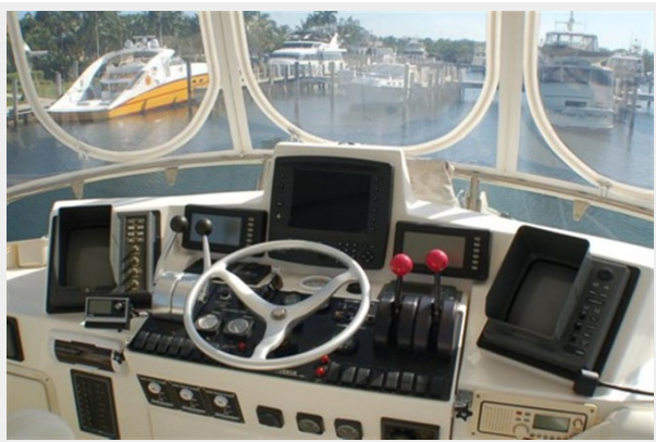
Flybridge Helm Station