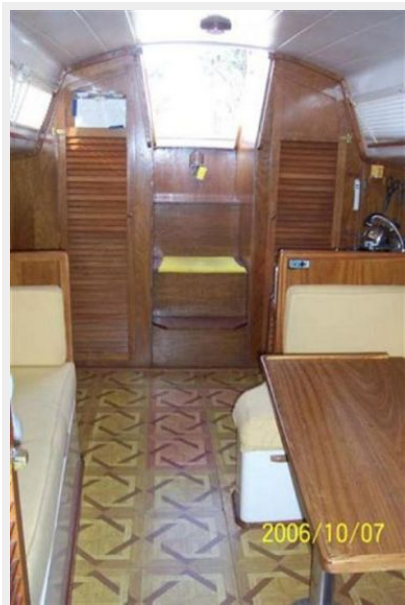
Cabin Aft View