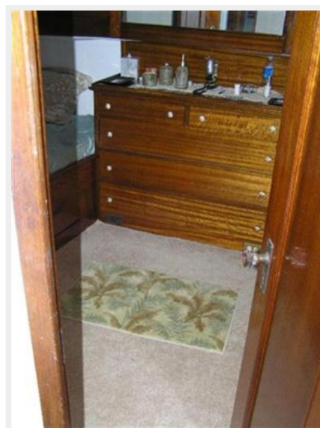
Master Stateroom Dresser