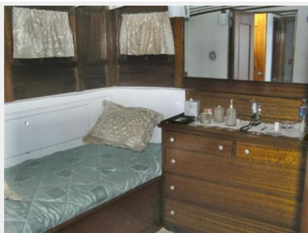
Master Stateroom Facing Aft Starboard