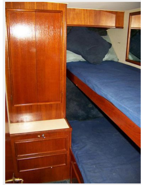
Sink and Cabinets