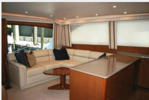
Salon facing Aft