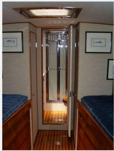
Entrance to Main Cabin Head