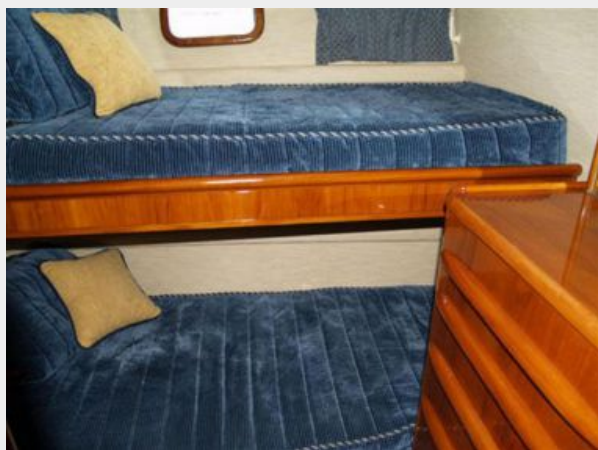
Wide Guest Upper / Lower Bunks