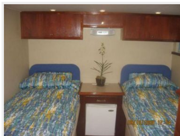
Port Guest Stateroom