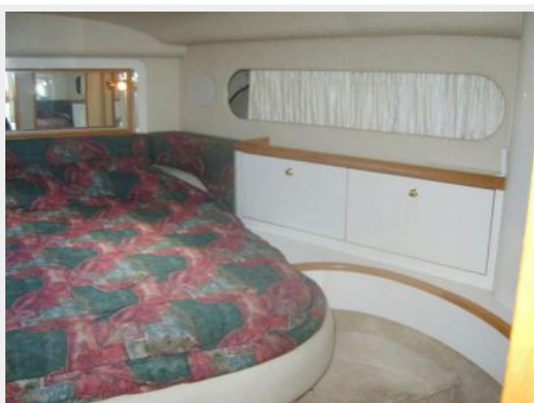
Master SR 1