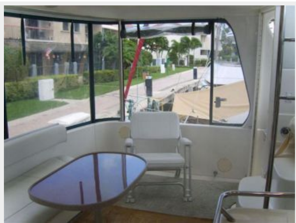
Aft Deck 1