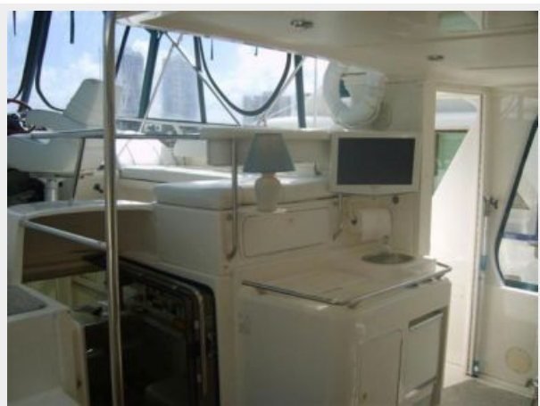
Aft Deck Wet Bar