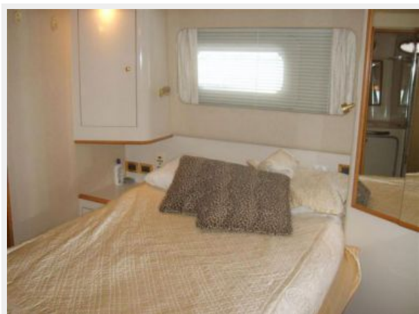
Guest SR 1