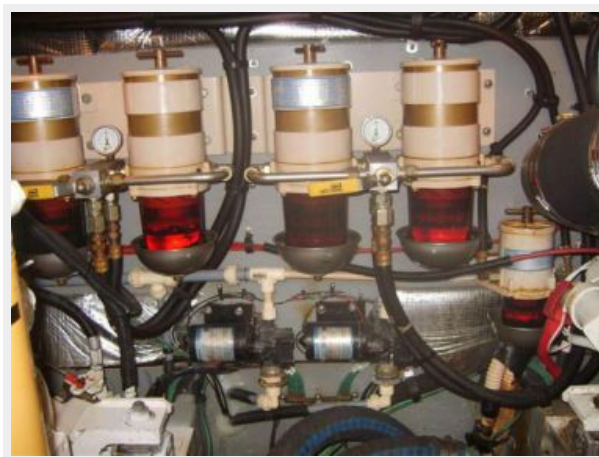
Engine Room 1