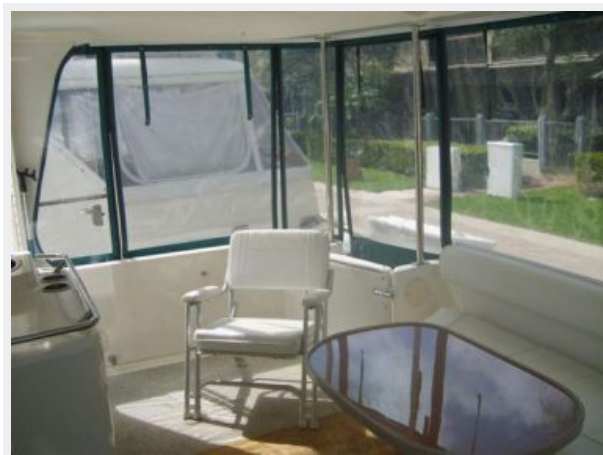
Aft Deck 2