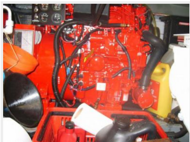
Engine Room 2