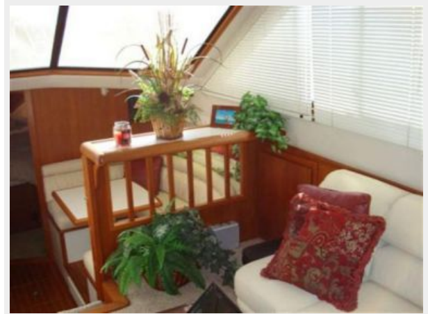
Salon to Starboard