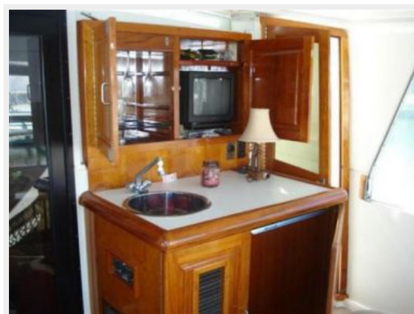
Wet Bar and Entertainment