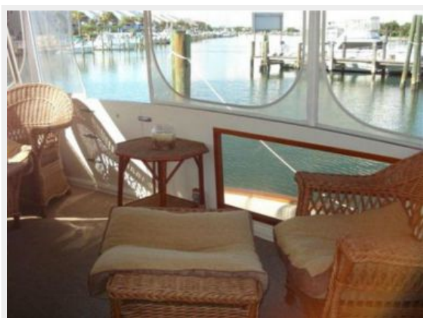
Aft Deck Seating