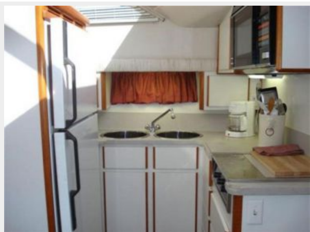
Galley to Port