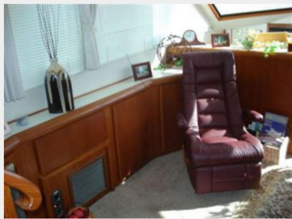
Salon to Port