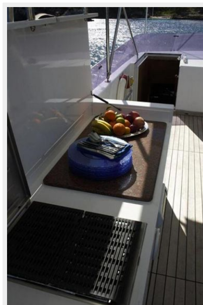
BBQ on flybridge