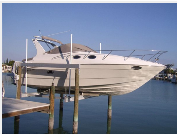
2002 30' Regal 3060 Commodore