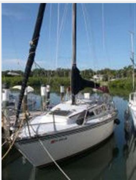
Ready to GO