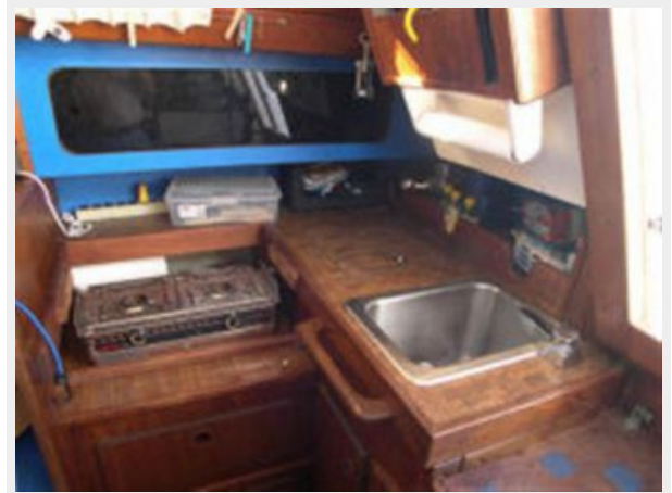
Galley (starboard side)