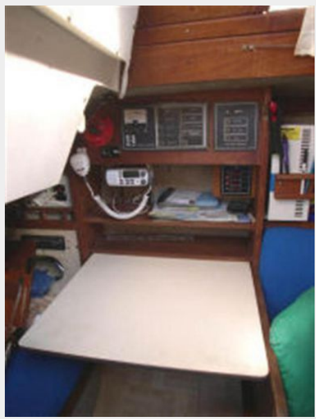
Navigation Station (port side)