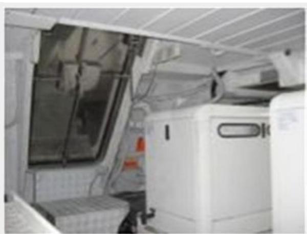
Engine Room 3