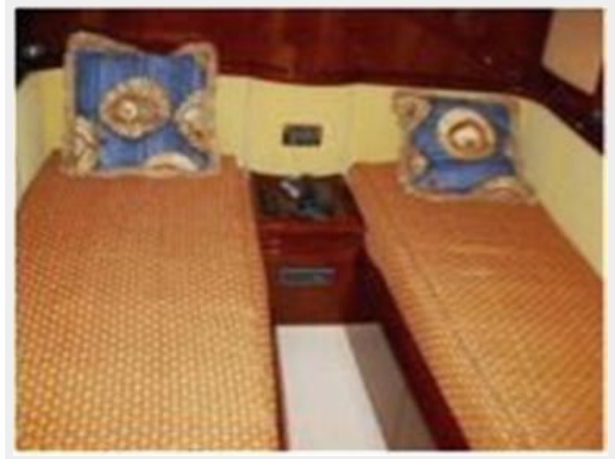
Guest Stateroom 1