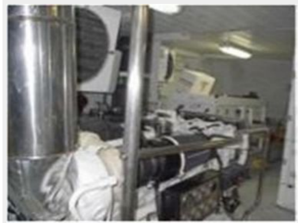
Engine Room 2