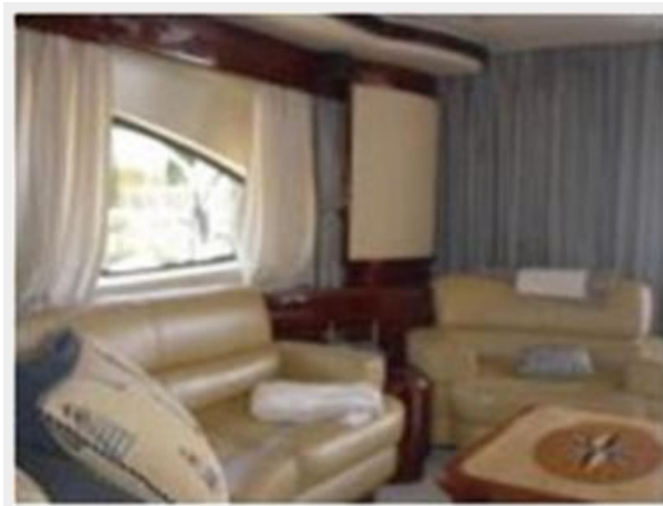
Main Salon 2