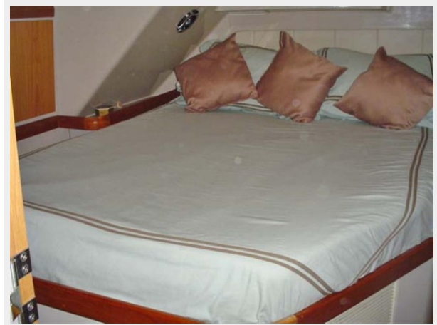
Master Stateroom, TV, Hanging Locker