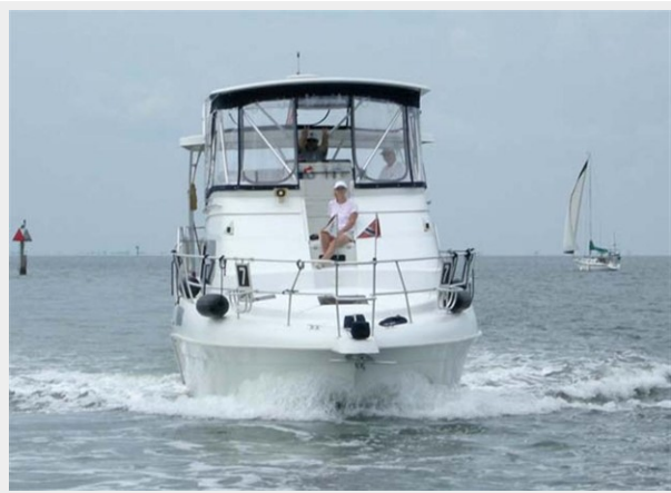
NEW HARDTOP, NEW STRATOGLASS ENCLOSURE