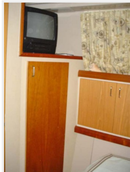
Master Stateroom, TV, Hanging Locker