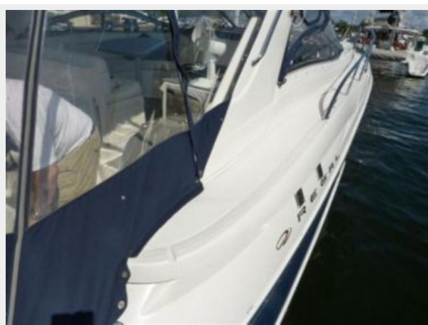
Regal Port Side