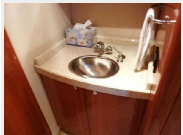
Aft Cabin Sink