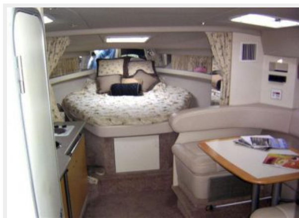
Inside looking forward