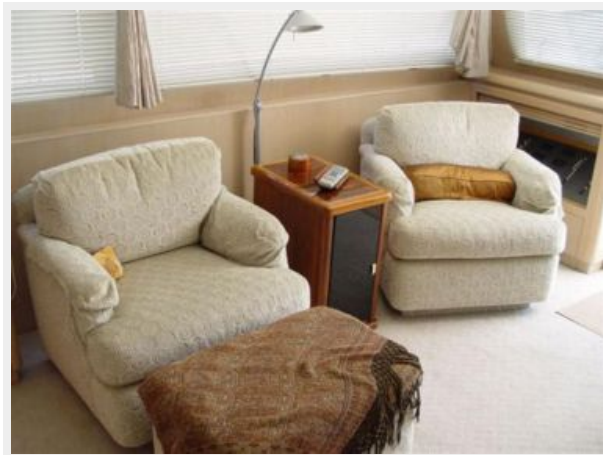
STARBOARD SIDE SALON