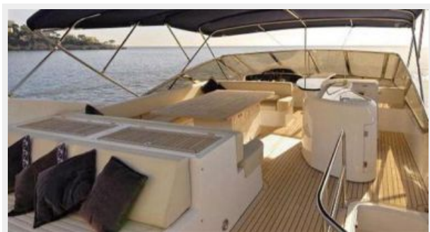
PHOEBE TRES exterior