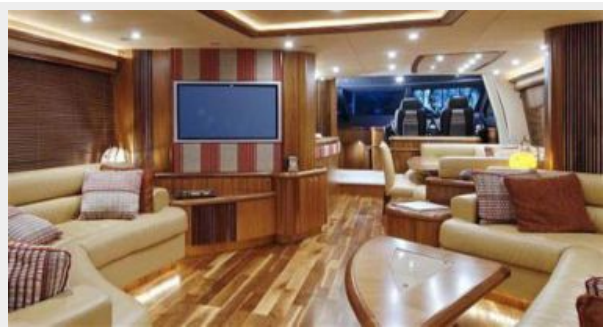
PHOEBE TRES -saloon