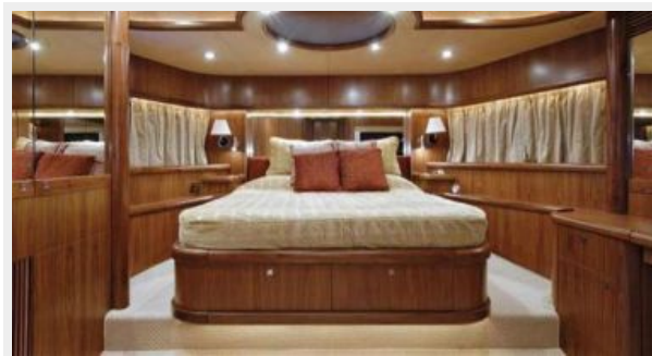
PHOEBE TRES cabin