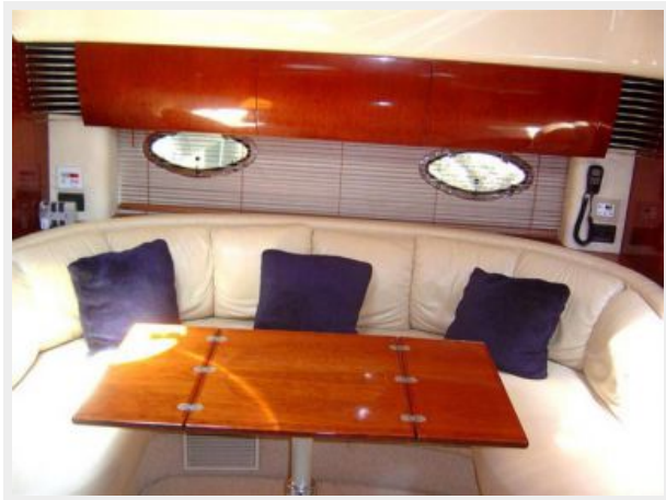
Sofa / Dinette