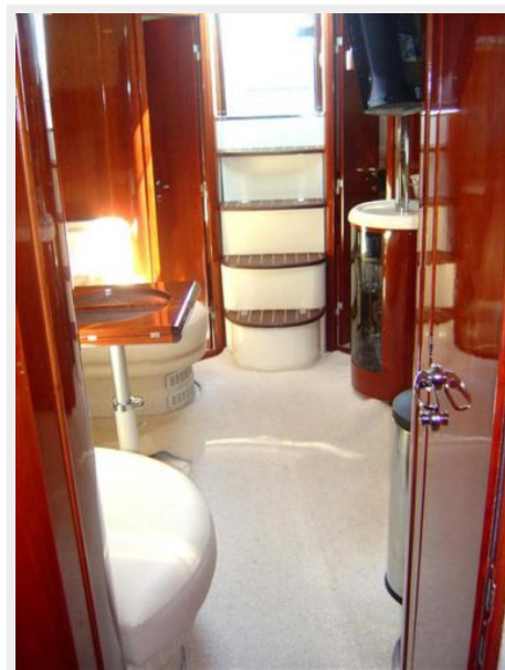
Salon Looking Aft