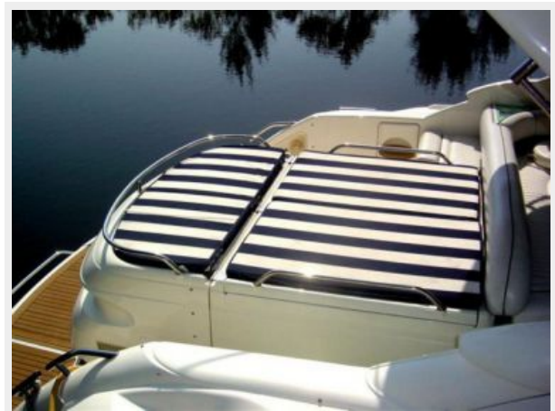
Aft Sun Pad