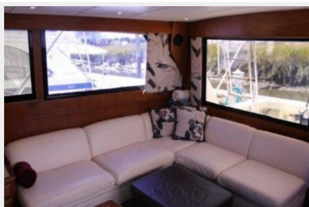
Salon Port Aft