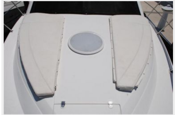
sun pad cushions