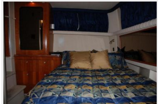
master head side view