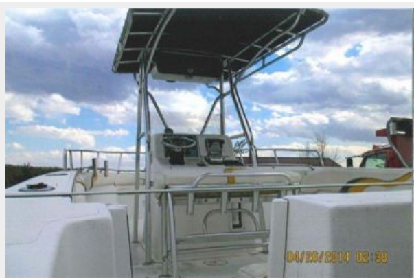
Center Console 1